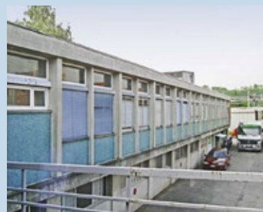
Blick auf das Vernier Areal

Die auf die Entwicklung von ehemaligen Industriearealen spezialisierte, börsenkotierte HIAG Immobilien hat Projekt Interim das Vernier Areal in Genf für eine Zwischennutzung bis September 2015 zur Verfügung gestellt. Nach dem Schönau Areal in Wetzikon ist Vernier das zweite Industrieareal, das HIAG Immobilien der Gesellschaft für eine Zwischennutzung anvertraut. Projekt Interim verleiht die Räume in der ehemaligen Pharma-Produktionsanlage zu sehr attraktiven Konditionen an Kreativtätige und Start-ups als Ateliers, Werkräume oder Büros. Einige wenige Räume sind noch verfügbar. Die auf Zwischennutzungen und Leerstandsmanagement spezialisierte Gesellschaft Projekt Interim hilft Eigentümern, Leerstand zu vermeiden oder zu überbrücken, indem sie Zwischennutzungen von Geschäfts- und Wohnliegenschaften, von Ladenlokalen und Industriearealen in der ganzen Schweiz strukturiert, organisiert und verwaltet. Mit seinen Projekten überbrückt Projekt Interim Übergangsphasen von ein paar Monaten bis zu mehreren Jahren.