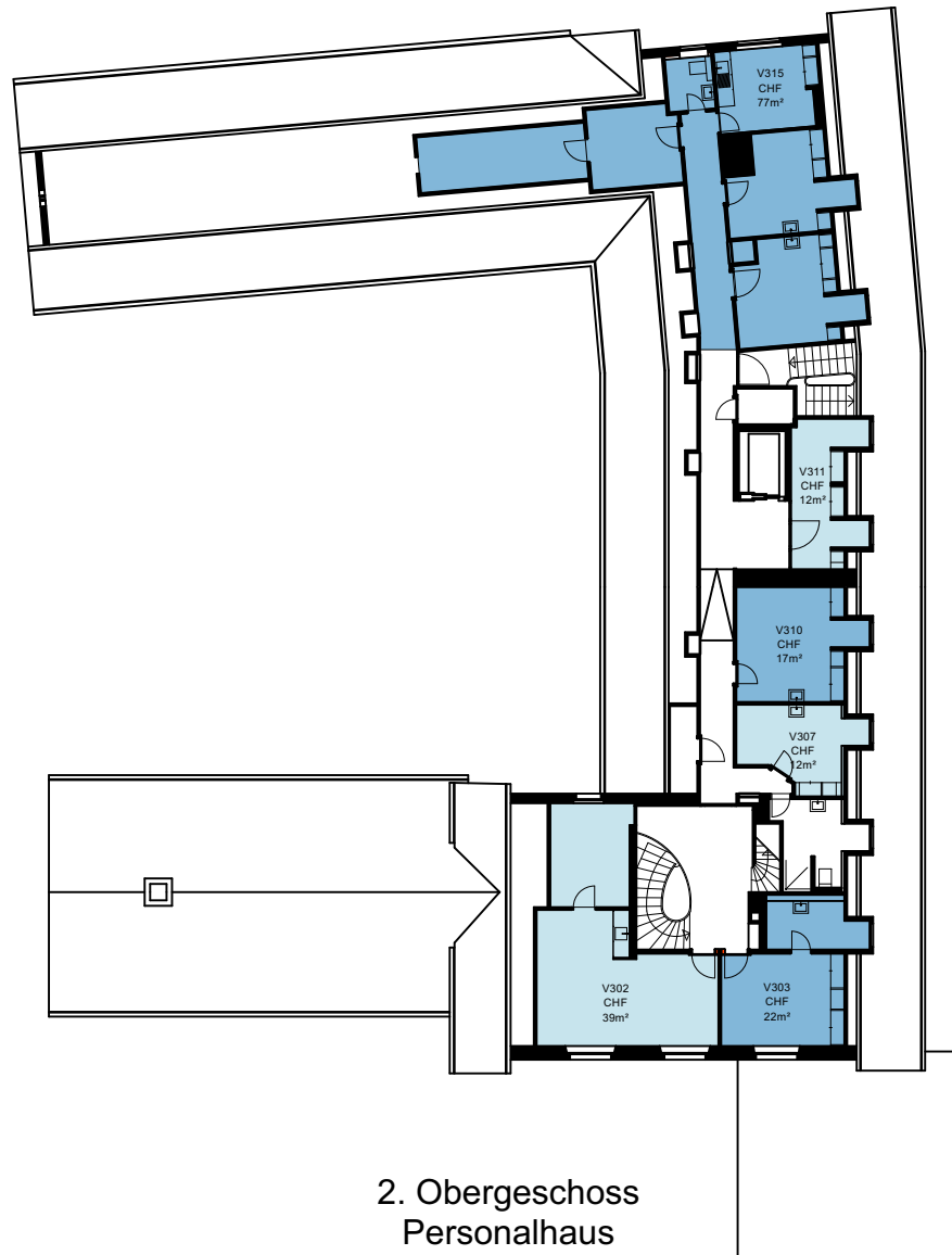
2. Obergeschoss Personalhaus Massstab: 1:300

Zwischennutzung Seestrasse 264, 8700 Küsnacht